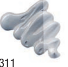
311 Gris Neutro ★★★ ■ PW6, PB29, PBK11