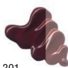
301 Rojo Oxido Transparente ★★★ □ PR101