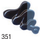
351 Sombra Azulada ★★★ ■ PB15:3, PBK11