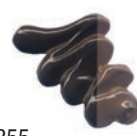
355 Sombra Natural ★★★ ■ PY42, PB6, PBK11