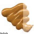
360 Amarillo Ocre ★★★ ■ PY42