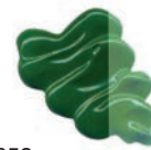
352 Verde Permanente Claro ★★★ ■ PY3, PY83, PG7