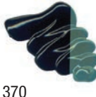
370 Verde Cuprico Claro ★★★ □ PG36