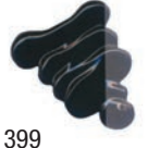
399 Gris de Payne ★★★ ■ PB29, PBK11