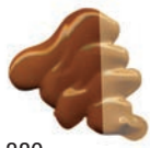
380 Amarillo Oxido Transparente ★★★ □ PY42