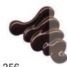
356 Sombra Quemada ★★★ ■ PW6, PR101, PBK7