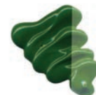
322 Verde Musgo ★★★ ■ PY3, PY83, PG7