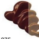
375 Stil de Grain Pardo ★★★ □ PY83, PR83, PG7