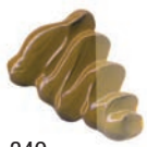
349 Amarillo Ocre Oro ★★★ ■ PY42, PR101, PBK11