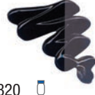
320 Negro ★★★ ■ PBK7