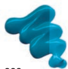
363 Azul Turquesa ★★★ ■ PB15:3, PG7