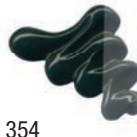
354 Tierra Verde ★★★ ■ PW6, PY83, PG7, PBK7