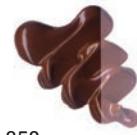
358 Tierra de Sombra Quemada ★★★ ■ PR101, PB6