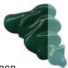
362 Verde Inglés Oscuro ★★★ ■ PW6, PY2, PB15:3