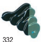
332 Verde Permanente Oscuro ★★★ ■ PG7