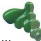
333 Verde Paul Veronese ★★★ ■ PW6, PY13, PB15, PG7