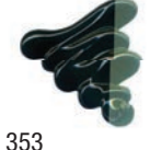
353 Verde Vessie ★★★ ■ PY83, PB15, PB27