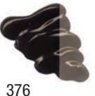
376 Marrón de Garanza ★★★ ■ PY83, PR83, PG7