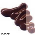
337 Marrón Van Dyck ★★★ ■ PY83, PR112, PB6, PBK7