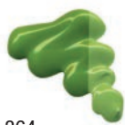
364 Verde Inglés nº 5 ★★★ ■ PW6, PY74, PB15:2, PG7