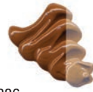
336 Tierra de Siena Natural ★★★ ■ PW6, PY42, PR101, PB6