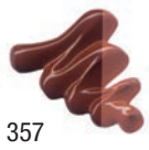
357 Tierra de Siena Quemada ★★★ ■ PY42, PR101