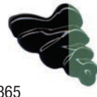
365 Verde Hooker ★★★ ■ PB15:3, PY83