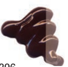
396 Sepia ★★★ ■ PR101, PBK11