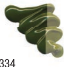
334 Verde Oliva ★★★ □ PY83, PB15:3, PBK7